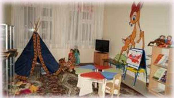
кабинет родного языка